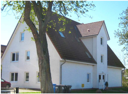
Ferienwohnung im 2.OG - Hausansicht