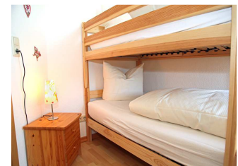
2. kleineres Schlafzimmer