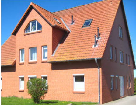
Ferienwohnung im 1.OG - Hausansicht