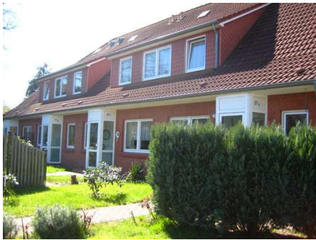
Ferienwohnung - Hausansicht