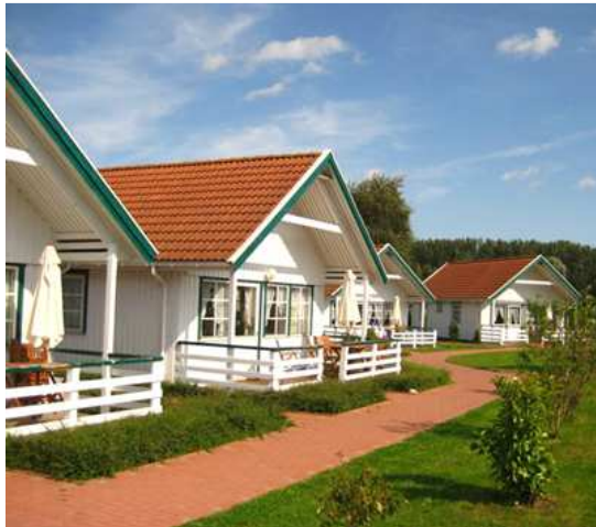
Ferienwohnung - Außenansicht