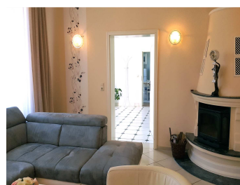
Wohnzimmer mit Kamin