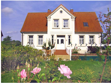
Ferienvilla - Hausansicht